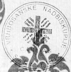
Mons. Tomo Vukšić nadbiskup